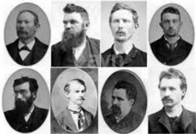
Georges Engels, Samuel Fielden, Adolf Fischer, Luis Ling Michael Schwab, Albert Parsons, Oscar Neebe y Hesscis Auguste Spies

Trabajo: Explique "El trabajo es para el hombre y no el hombre para el trabajo"