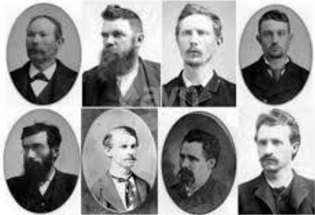
Georges Engels, Samuel Fielden, Adolf Fischer, Luis Ling Michael Schwab, Albert Parsons, Oscar Neebe y Hesscis Auguste Spies

Trabajo: Explique "El trabajo es para el hombre y no el hombre para el trabajo"