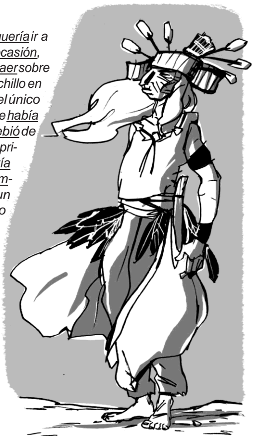
Jordi SIERRA I FABRA

El día en que Tortuga Veloz observó mis manos fue el último día que vimos a nuestro amigo como siempre le habíamos visto. Por eso guardo un recuerdo muy especial de él. Ya nada sería igual a partir de ese día, y los ciegos impulsos de la naturaleza humana desencadenarían la tempestad a la que nos vimos semiautomáticamente arrojados. Cuando Susan y yo regresábamos a casa, estuvimos comentando lo que no nos atrevimos a expresar en la cabaña: el aspecto de Tortuga Veloz. Como papá, él también, a veces, parecía envejecer súbitamente. Fuesen cuales fuesen los sueños de la noche anterior, tuvieron que ser muy especiales y de muy difícil interpretación, a pesar de sus mágicos poderes de hechicero miwok.